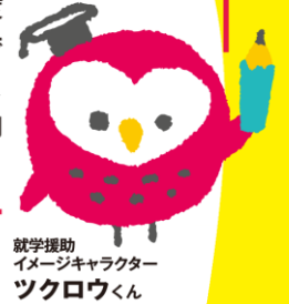
就学援助 イメージキャラクター ツクロウくん

学校教育法などにもとづいて、小中学校の子どもがいる家庭に学用品費や学校給食費などを市町村が援助する制度です。子どもたちの安心して楽しい学校生活のために、気軽に就学援助制度を活用してみませんか。